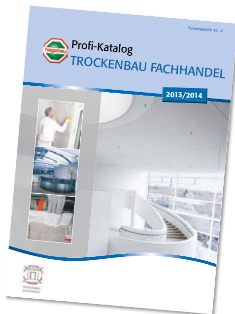
Druckfrisch: Der Profi-Katalog TROCKENBAU FACHHANDEL ist erstmals im handlichen DIN-A5-Format erschienen.