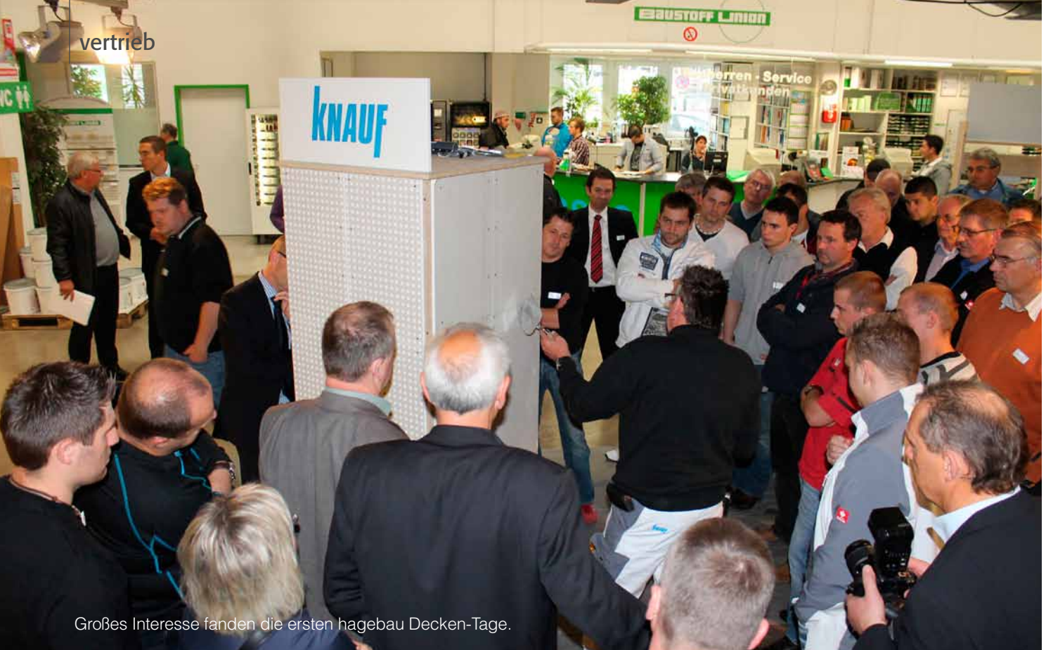
Großes Interesse fanden die ersten hagebau Decken-Tage.