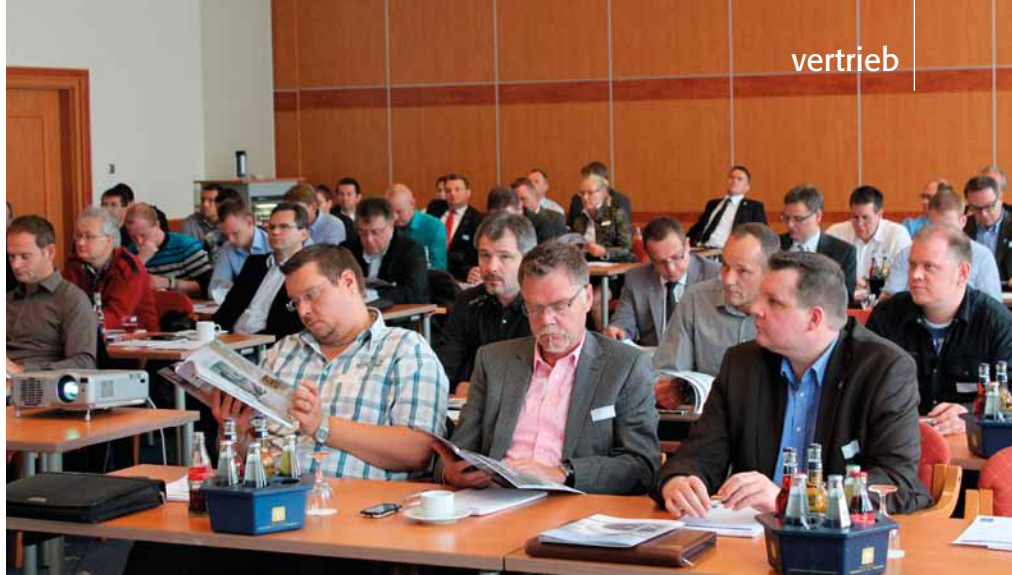
Händler und Industriepartner erarbeiteten bei den Jahrestreffen Brandschutz und Decke neue Möglichkeiten der gemeinsamen Marktbearbeitung.

Neu entwickelt hat der TROCKENBAU FACHHANDEL die „Brandschutz Aufbau-