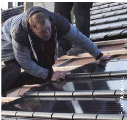
Moderne Indachsysteme begeistern Hausbesitzer mit ihrer Optik – und haben viele weitere Vorteile.

Ein weiterer Punkt ist die Solardachpflicht, die bereits in mehreren Bundesländern gilt und voraussichtlich ab 2024 bundesweit eingeführt wird. Bauherren und Hausbesitzer sind damit auch rechtlich verpflichtet, sich mit dem Thema zu beschäftigen. Aber schon ab 2023 werden viele steuerliche und bürokratische Hürden abgebaut, um den Bau von Solardächern zu beschleunigen: Insbesondere private Betreiber können ihre neue PV-Anlage ab 1.1.23 zum Nettopreis erwerben und installieren