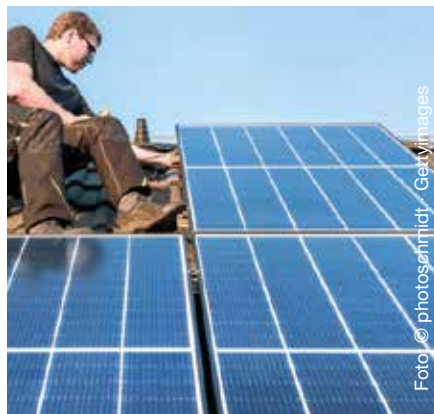
Aufdachanlagen sind bekannt und immer noch gängig. Sie sind jedoch anfällig für Schäden und optisch für viele Bauherren ein Problem.

Wie Sie sich das Know-how aneignen und zum zertifizierten „Photovoltaik-Manager im deutschen Dachdecker-Handwerk“ werden können, welche Solaranlagen bei Hausbesitzern im Trend liegen und wie moderne Systeme Sicherheit garantieren, lesen Sie in dieser Fachreihe.